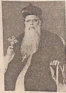
ഗിവർഗീസ് മാർ ദിയസ്കോറോസ് ഓർമ്മ ജൂലൈ 24